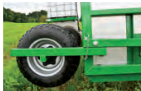
Für den Transport kann das Tastrad weggeschwenkt werden, keine Demontage nötig.