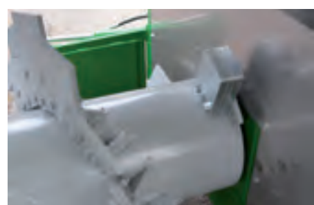
12 mm Schlägerdicke mit 3 Befestigungsschrauben. Die gewuchtete Welle sorgt für eine lange Lebensdauer.