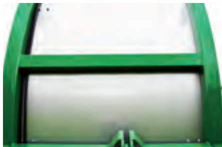
Alle Verschleissbleche sind aus Chromstahl.