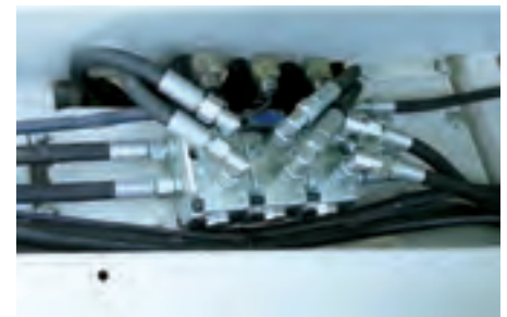
Elektrohydraulische Ventilbank mit Bedientpult (einfach, zweifach oder dreifach)