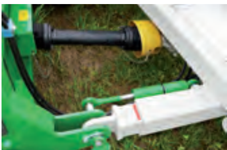
Direkter Antrieb – Getriebe auf Umsetzwelle