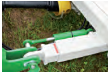
Hydraulische Seitenversatzung, damit die Miete da bleibt, wo sie hingehört.