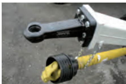
Standard-Anhängerkupplung vorne: DIN-Zugöse