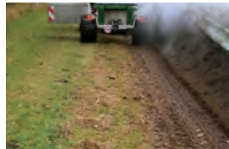
Dank dem Schwenkgewicht ist auch das Befahren einer Wiese möglich. Ausserdem sorgt es für eine optimale Gewichtsverteilung und verringert das Gesamtgewicht um ca. 1'500 kg.