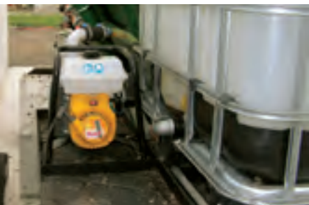
Die Wender sind so konzipiert, dass auch eigene Wasserpumpen montiert werden können.