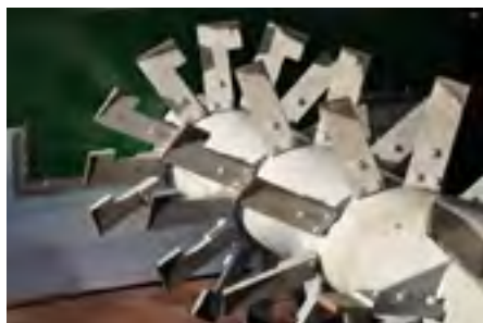
Eine gute Umsetzwelle arbeitet das Material von innen nach aussen, damit die Mikroorganismen sich überall optimal vermehren können.