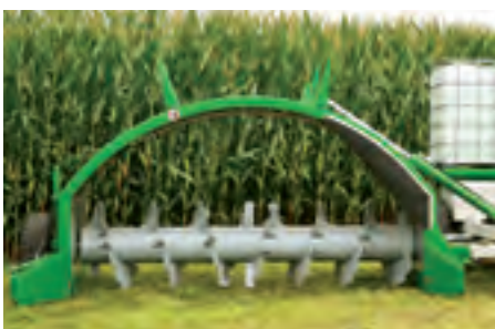
Die massive Bogenkonstruktion aus 6 mm Stahl sorgt für eine sehr grosse Stabilität.