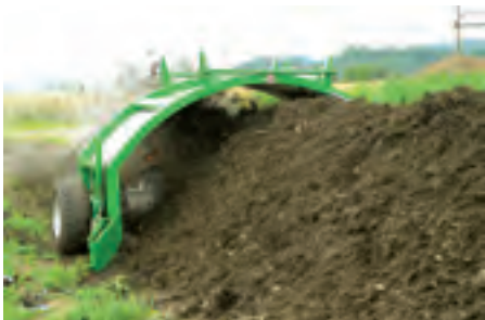
Maximale Mietengrösse: 3 x 1.5 m, damit aerob kompostiert werden kann.