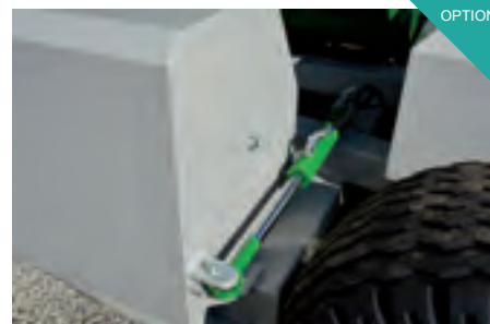
Seitengewicht hydraulisch schwenkbar