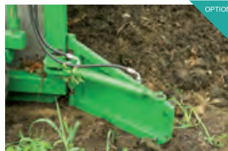
Hydraulisches Zuführschild rechts