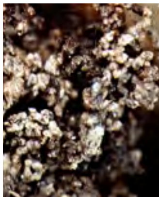
Perfekter Krümelaufbau – mikroskopische Ansicht

Zudem speichert ein humusreicher Boden auf natürliche Weise CO 2 und schützt somit unser Klima.