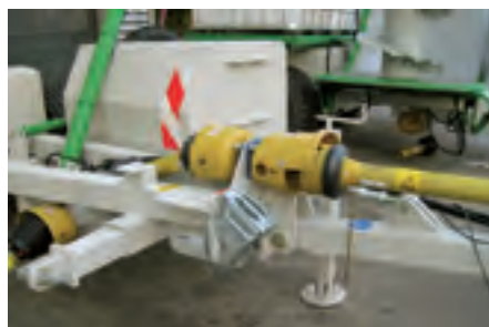
Untenanhängung für Tiefzug für Hitch mit Piton oder K80.