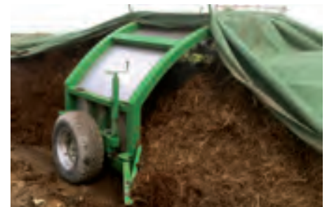
Das Vlies wird auf schmale Breite zusammengeführt, damit die Gase entweichen können. Die schwere Handarbeit bei nassem Vlies entfällt.