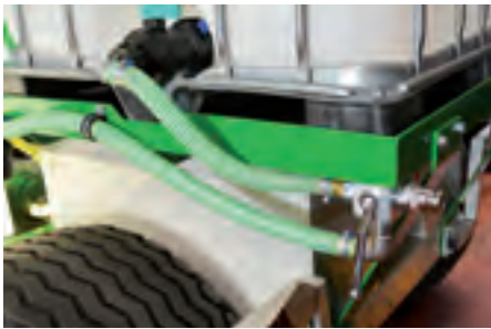
Externe Wasseransaugmöglichkeit für Fremdansaugung.