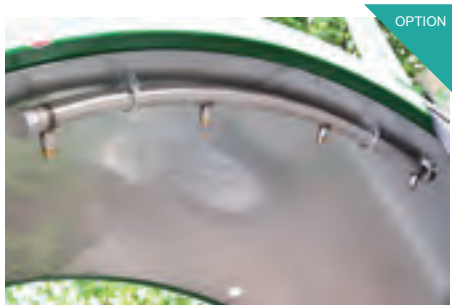
Wasserspritzbalken mit Düsen. Für die Erreichung eines optimalen Mikroorganismus-Klimas innerhalb der Miete ist die Zugabe von Wasser unerlässlich.