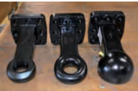
DIN (Serie) Piton K80